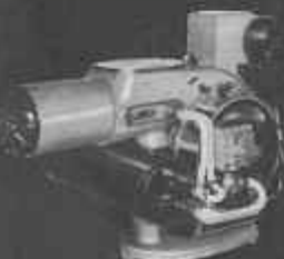
GC 3 de 250.000 à 500.000 cal/h.

Ateliers Cautisson s.a. au capital de 400 000 n.f. 26, rue Desseaux, Rouen tél. + 71-79-59 r. c. 54 b 47