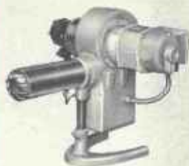
YC de 12.000 à 30.000 cal/h.