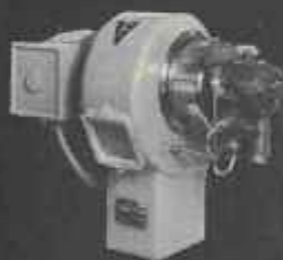
CC (sur charnière) de 20.000 à 85.000 cal/h.