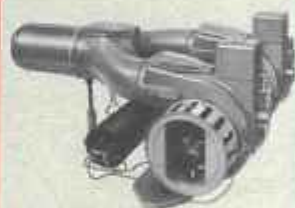
GC 4 de 500.000 à 950.000 cal/h.