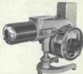
GC 2 de 80.000 à 250.000 cal/h.