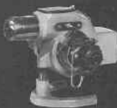
GC de 20.000 à 85.000 cal/h.

Ateliers Cautisson s.a. au capital de 400 000 n.f. 26, rue Desseaux, Rouen tél. + 71-79-59 r. c. 54 b 47