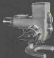
GC 1 de 30.000 à 100.000 cal/h.