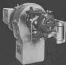
JC (sur charnière) de 12.000 à 30.000 cal/h.